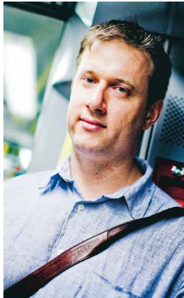
–Varje gång jag ser min pappa och att han mår bra känner jag att det verkligen var värt det. Jag är också glad att sjukhuset vågade operera oss – det är otroligt vad värden kan göra.

Läs en längre version av intervjun: »svd.se/idag